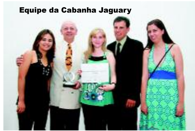
Equipe da Cabanha Jaguary