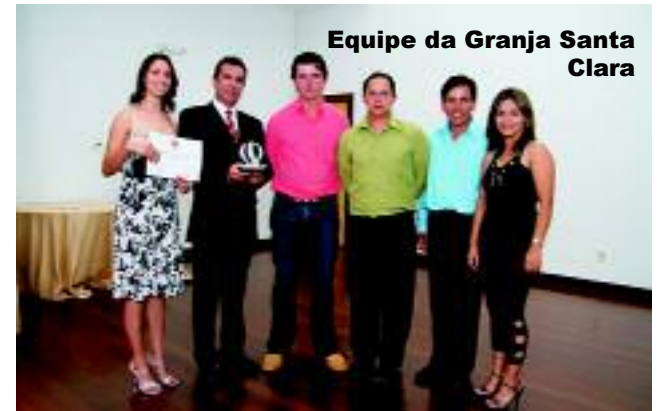
Equipe da Granja Santa Clara