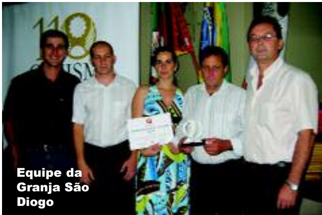
Equipe da Granja São Diogo