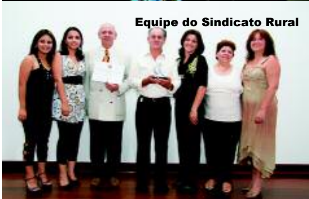
Equipe do Sindicato Rural