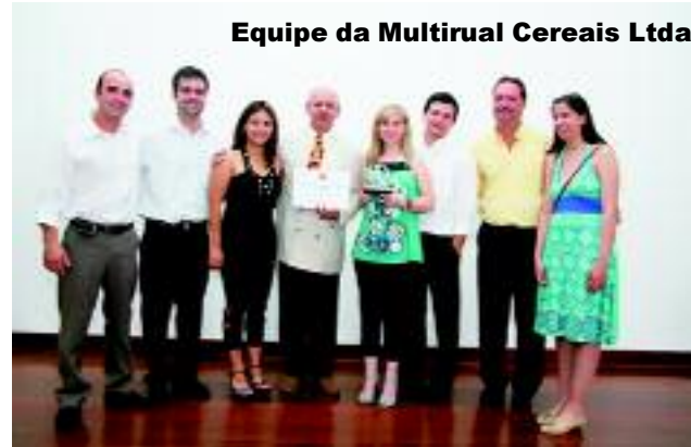
Equipe da Multirural Cereais Ltda